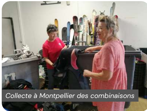
Collecte à Montpellier des combinaisons