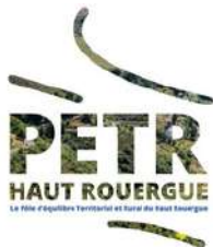
Le pôle d'équilibre territorial et rural du Haut-Rouergue