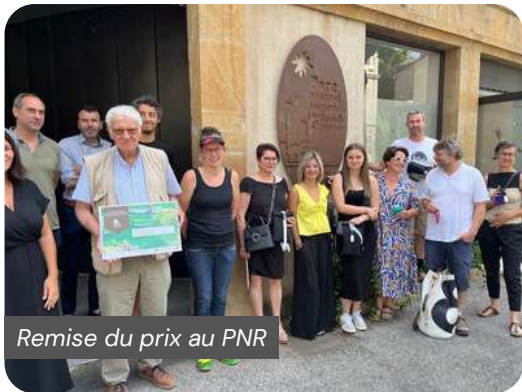
Remise du prix au PNR

Afin de réduire les coûts de production et le prix de vente, un nouveau procédé de découpe par presse a été identifié au sein d'une entreprise adaptée lozérienne (EA AFLPH Coloz), qui assure également l'impression et l'étiquetage. La récupération de matière est en cours afin de pouvoir livrer la première commande au printemps. La Revisière arrive !