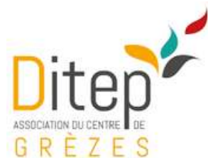
DITEP de Grèzes

Un grand Merci aux adhérents qui soutiennent l'association, de leurs petites attentions durant l'année ainsi qu'à nos chers bénévoles à qui on demande de s'adapter aussi vite que l'association grandit !