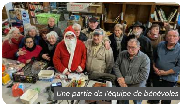
Une partie de l'équipe de bénévoles

Bénévoles et salariées œuvrent à maintenir une boutique de seconde main agréable et bien organisée, tout en gérant les flux constants d'objets entrants et sortants de la recyclerie. En 2025, nous avons pu compter sur l'arrivée de nouvelles forces vives, ce qui a permis d'assurer des ouvertures supplémentaires en soirée pendant les beaux jours.