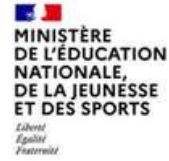
Le ministère de l'éducation nationale, de la jeunesse et des sports